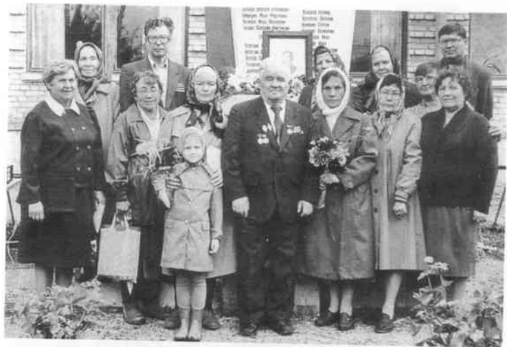
Бывшие выпускники Мехонской школы у памятника погибшим учителям и ученикам в годы Великой Отечественной войны. 1990 г.