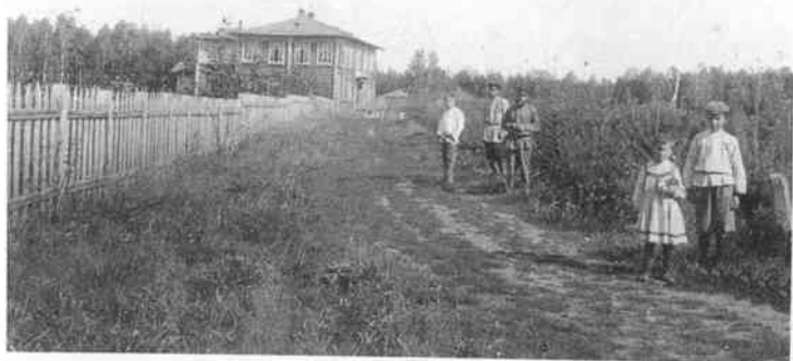
Мехонское городское училище. 1893 г.