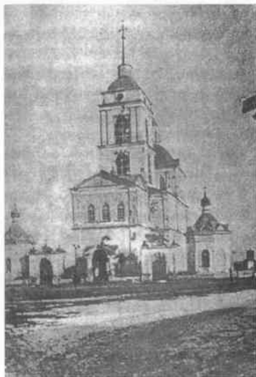
Мехонская Свято-Троицкая церковь. 1924 г.

духовной семинарии и служит в церкви, а в 1856 г. он оказался в селе Замараево Шадринского уезда священником Знаменской церкви. В этом селе он прожил 27 лет. Служил в церкви, занимался математикой. Отсюда ушло в Императорскую Академию наук в Петербург самое большое в это время простое число два в шестьдесят первой степени, минус один, равное двум квинтиллионам 305 квадриллионам 843 триллионам 009 миллиардам 213 миллионам 693 тысячам 951 единице — это «число Первушина».