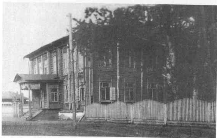
Мехонское городское начальное училище. 1893—1946 гг.