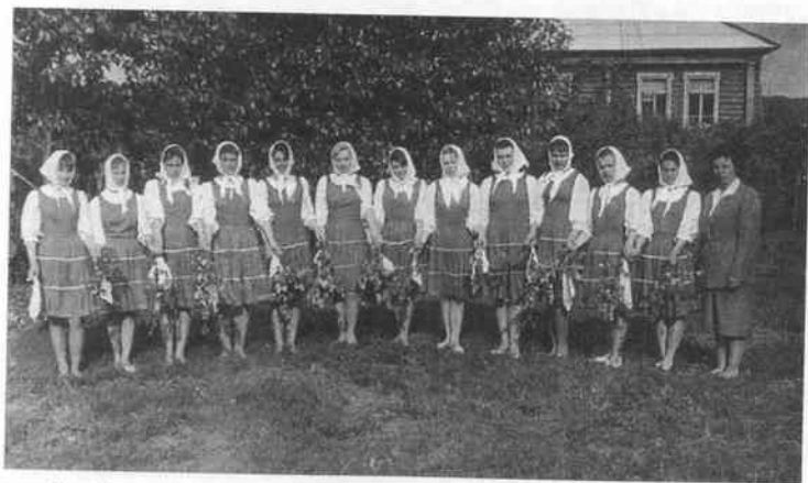
При Мехонском Доме пионеров создан танцевальный ансамбль «Березка». 1965 г.