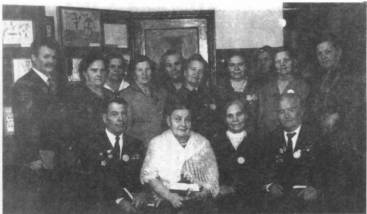
На 50-летию школы бывшие учителя и ученики. 4 декабря 1988 г.