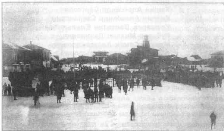
1938 год. Митинг, посвященный открытию XVIII съезда ВКП(б) в с. Мехонском.

В тридцатые годы работает клуб, Дом пионеров (в доме Распутиных, сейчас на этом месте почта). Появилось в домах радио, в клубе шло первое звуковое кино «Мы из Кронштадта».